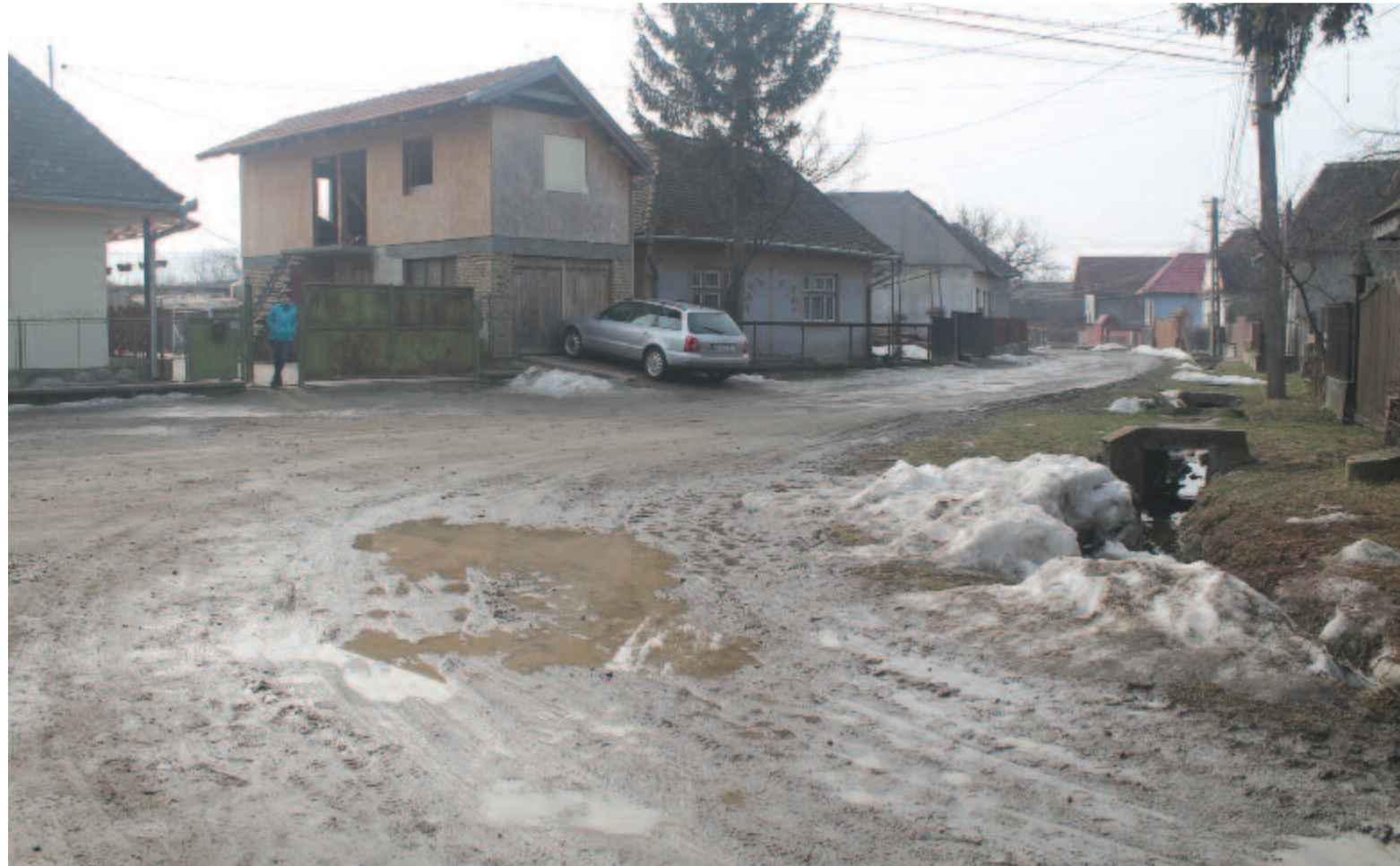
Kibédi községi út